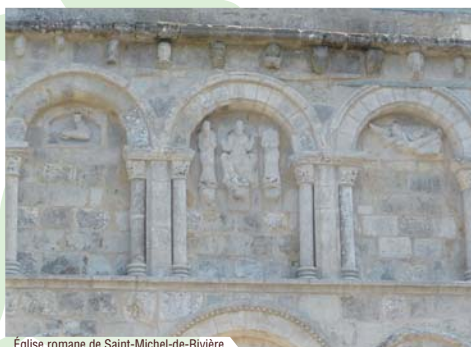
Église romane de Saint-Michel-de-Rivière.

Des rencontres culturelles au Temple... lieu d'expositions qui ouvrira ses portes en août 2010 ou sur grand écran au cinéma, en salle, en plein air l'été !