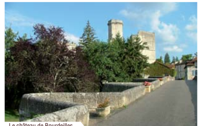
Le château de Bourdeilles.

Toutes les informations touristiques sur www.tourisme-saintaulaye.fr