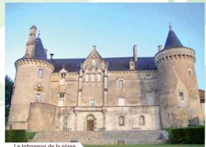
Le toboggan de la plage.