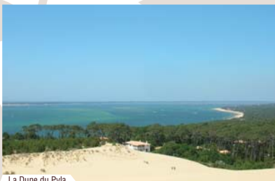
La Dune du Pyla.

Le Pays Dronne-Double en Périgord est au cœur des grands sites Aquitains, Périgourdins et Charentais.