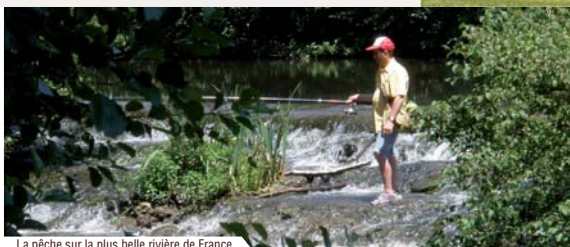
La pêche sur la plus belle rivière de France.