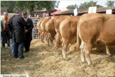
Foire de La Latière.

La Foire à La Latière accueille 15 000 visiteurs au cœur de la forêt de La Double, le festival des musiques épicées et les marchés nocturnes animent votre séjour.