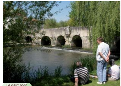
Le vieux pont.