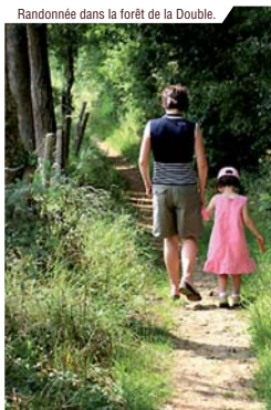
Randonnée dans la forêt de la Double.