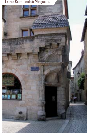
La rue Saint-Louis à Périgueux.

Passez une journée sur la côte Atlantique à Arcachon, la Dune du Pyla, Royan et le Zoo de la Palmyre. Sillonnez le Parc Naturel Régional Périgord-Limousin, visitez le Pays des Bastides ou explorez les grottes du Périgord Noir.