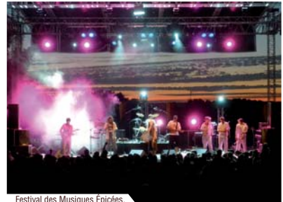
Festival des Musiques Épicées.